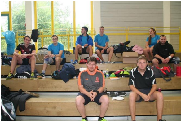
5 Unsere Spieler/innen warten auf ihren Einsatz

Am letzten September-Wochenende war es dann so weit, dass erste offizielle Badminton-Turnier unter Corona-Bedingungen. Die Sportfreunde Dornstadt haben sich sehr viel Mühe gegeben, einerseits die Corona-Regeln einzuhalten und andererseits ein sportlich interessantes Turnier zu bieten. Das ist ihnen wirklich gelungen. An den Offenen Ulmer Stadtmeisterschaften nahmen Spieler/innen aus ganz Württemberg teil. Traditionell werden auch Vereine aus der bayerischen Umgebung eingeladen. Wir waren mit 11 überwiegend jüngeren Spielern dabei.