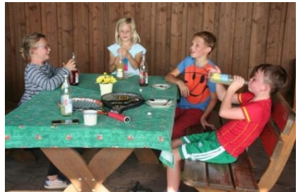
4 Auch die Kinder hatten Spaß