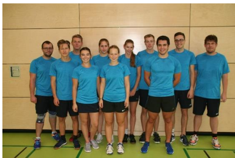
2 Die Zweite

Für die Erste lief die Saison sehr erfolgreich. Bis zum vorletzten Spieltag am 8. März 2020 war die Mannschaft ungeschlagen und führte die Tabelle überlegen an. Die Zweite schlug sich wacker. Dank eines Sieges im zweiten Spiel am vorletzten Spieltag kletterte sie auf den siebenten Platz. Der vorletzte Spieltag war überhaupt etwas ganz Besonderes. Beide Mannschaften konnten ihre Heimspiele gemeinsam in der Gustav-Benz-Halle austragen. Insgesamt acht Mannschaften waren anwesend.