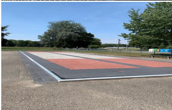
(Baubeginn und Fertigstellung in 2020)