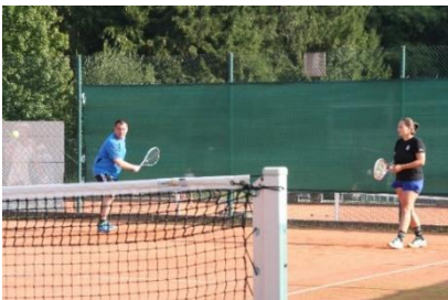
3 Bestes Wetter in Wullenstetten