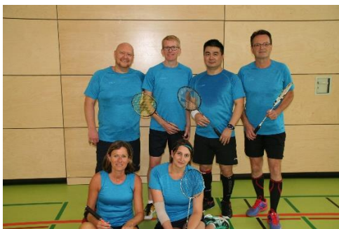
1 Die Erste ohne Sandra, Sabrina, Olga, Florian, Marcus, Jack und Thomas

Unsere Badmintonseason fing vielversprechend an. Erstmals seit 3 Jahren ist unsere Spielgemeinschaft mit dem TSV Pfuhl wieder mit zwei Mannschaften angetreten. Unsere Erste war bekanntlich in die Bezirksklasse A abgestiegen, die Zweite musste in der Bezirksklasse B unten anfangen.