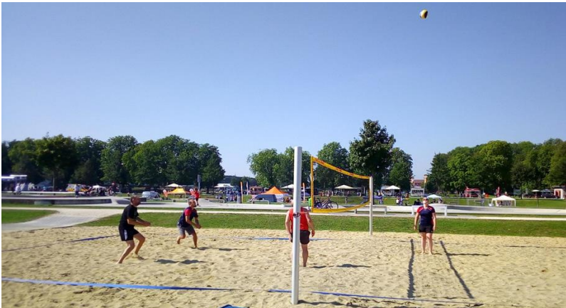
Beachen am Vormittag

Zeit unter uns, so dass erst am Nachmittag sich die ersten „fremden Interessenten“ trauten mitzuspielen.