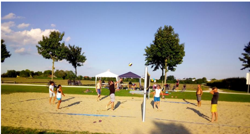
Situation am Nachmittag