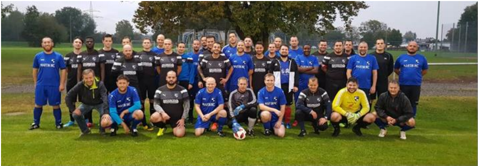
Unsere attraktiven Herren zusammen mit den aktiven Fußballern

Jeder ist herzlich willkommen, ob Fußballgenie oder nur um Spaß an der Bewegung zu haben. Freiluft- sowie Hallenturniere, das Kaffeekränzchen und der Herbstausflug sind feste Bestandteile des Terminkalenders.