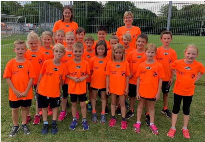
Unsere Finalisten der Schülerliga 2019

Und am Ende konnten wir sogar noch über einen Sieg der 2011er, sowie einen etwas unglücklichen, dennoch tollen 2. Platz der 2012er-Kids jubeln. Unglücklich deshalb, weil lediglich ein Meter beim Werfen zum Sieg gereicht hätte.