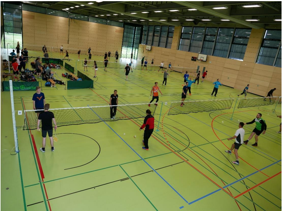
Volle Halle bei den Kreismeisterschaften 2019

Das herausragende Ereignis der vergangenen Saison war für uns die Offenen Kreismeisterschaften 2019, die wir erstmals in der neuen Gustav-Benz-Halle austragen durften. Über 80 Teilnehmer sorgten für eine Rekordbeteiligung. 11 Spielfelder waren in der Dreifachsporthalle fast ständig belegt. Leider ist die Küche in der neuen Halle nicht eingerichtet, sodass wir bezüglich der Bewirtung improvisieren mussten, was aber hervorragend geklappt hat.