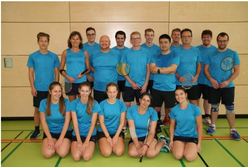
Unsere Mannschaftsspieler/innen in ihren neuen Trikots

Wir haben seit längerem eine Spielgemeinschaft mit dem TSV Pfuhl und nehmen mit einer Mannschaft am Spielbetrieb des bayerischen Badmintonverbandes teil. Während die Saison 2017/2018 noch mit einem erfolgreichen 4. Platz in der Bezirksliga Süd abgeschlossen wurde, reichte es in der folgenden Saison 2018/2019 aufgrund vieler Verletzungen und einer Schwangerschaft nicht mehr zum Klassenerhalt.