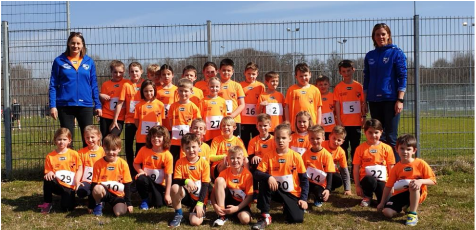
Großes Aufgebot in orange bei den Kreis-Waldlaufmeisterschaften im April 2019

Auch im vergangenen Jahr fanden immer mehr Kinder Spaß an unserer komplexen Sportart. Unsere Gruppen werden stetig größer und bei Wettkämpfen sind wir mittlerweile fast immer die teilnehmerstärkste Mannschaft hinter dem Großverein SSV Ulm 1846.